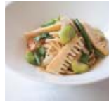
筍とそら豆の パスタ p10