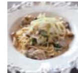
白菜と牡蠣の クリームパスタ p58