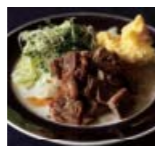
サイコロステーキ サラダ p46