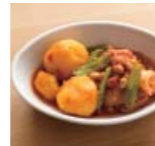
新じゃがのトマト煮 p20