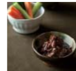
豚みそ 鹿児島県 p72