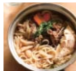
きのこde すき焼きうどん p40