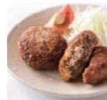
スタミナ メンチカツ p34