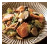
秋鮭とちんげん菜の みそバター炒め p44