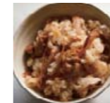
かしわ飯 福岡県 p68