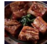
角煮 長崎県 p66