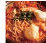
キムチ ちゃんぽん p60