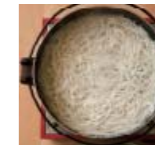
五島うどん地獄炊き 長崎県 p76