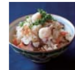
たご飯 広島県 p74