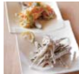
キビナゴのからあげ ～中華あんかけ～ p16