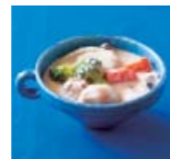
豆乳と里芋の シチュー p42