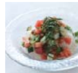
ぶっかけそうめん p28