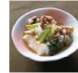
豚肉と餅の みぞれ煮 p54