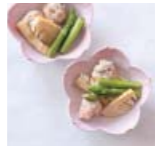
筍と鶏団子の煮物 p18