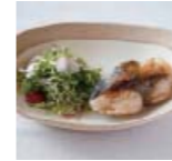
ぶりのバター焼き p52