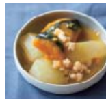
冬瓜と南瓜の えびそぼろ煮 p30