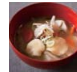
だんご汁 大分県 p70