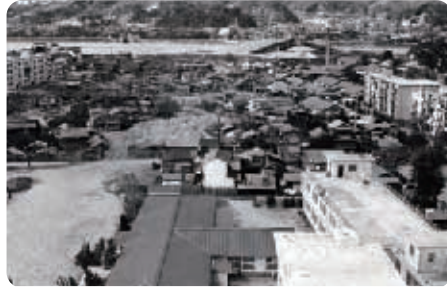
埋め立て中の福島川下流部（中央部）、1960年。

広島は川の街です。普段は意識 しませんが、こんなに多くの川が 流れている街は、日本中を探して も、そうはありません。