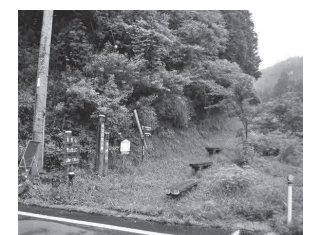
笹山 / 笹山登山口