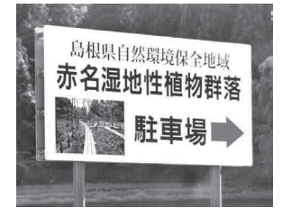
赤名 / 赤名湿地の案内看板