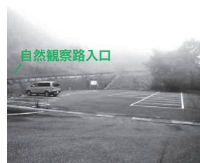
青野碓 / 青野碓(青野河原) 駐車場