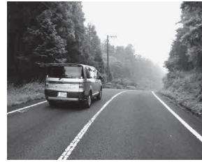
青野碓 / 林道笹山入線