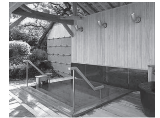
笹山 / 道の駅 願成就温泉・露天風呂