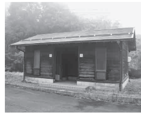
青野碓 / 同駐車場のトイレ