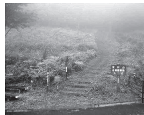
青野碓 / 青野山自然観察路入口