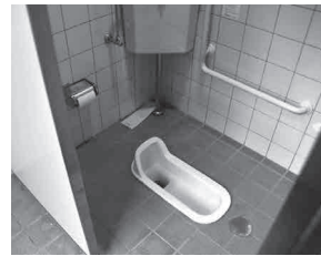
青野碓 / 同トイレ内部