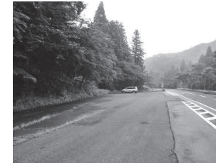
笹山 / 県道路肩の駐車スペース