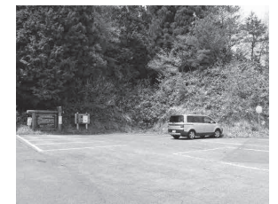
赤名 / 赤名湿地散策者用の駐車場